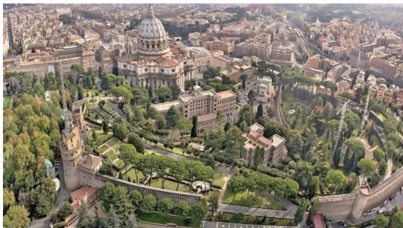
Le Vatican coté jardins

Définir le mot FOI s'est avéré être l'une des choses les plus difficiles à faire pour l'humanité, et cela a souvent été la cause directe de la relégation de nombreuses vérités spirituelles profondes dans le domaine des mystères. Le « mystère », lorsqu'il n'est pas maintenu vivant par Foi, soit s'efface complètement, soit devient un vrai mystère. Ainsi, en lui enlevant sa signification, le vrai sens reste caché aux profanes. Ce qui était autrefois vrai - même si cela n'était pas compris - devient désormais une source légitime de doute et d'incrédulité. Il y a beaucoup de lois spirituelles qui ne sont pas comprises et ainsi, pour l'essentiel, il a été demandé à l'humanité de procéder uniquement avec la Foi, une Qualité qui manque chez la plupart, et rares sont ceux qui l'ont réellement développée en eux-mêmes. Pourtant même les chercheurs de Vérité comme vous, trouvent que la « Foi » est plus que jamais nécessaire dans le Nouvel Âge qui vient de poindre.