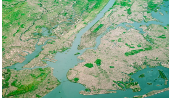
Manhattan vue satellite

Au-dessus de l'île de Manhattan à New York, aux États-Unis, dans le Royaume éthérique, se trouve le Temple du Cercle et de l'Épée. Cette Retraite des Elohim de la Puissante Astrea (Elohim féminin de la Pureté), est son Centre d'activité principal pour la Planète. Ici, Elle dirige la Purification Cosmique de notre Monde avec précision. L'utilisation du Cercle et de l'Épée est destinée à libérer tout ce qui n'est « pas de la Lumière » dans le monde de la forme. Cela concerne le karma, l'énergie mal qualifiée et la conscience humaine. C'est la Puissante Astréa qui coupe la ligne de force qui lie à l'expérience humaine et élève l'âme dans la Liberté éternelle en cette période de transition.